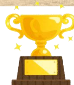
第64回福山市少年少女親善球技大会